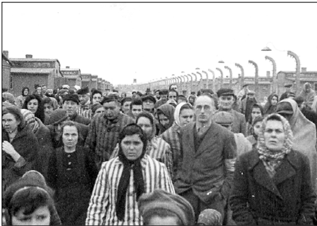
PRESONERS DURANT L'ALLIBERAMENT DEL CAMP DE CONCENTRACIÓ D'AUSCHWITZ

vaig referir en la introducció que vaig escriure per al primer volum ( Narrativa , 2001), l'únic fins ara publicat, de les seves Obres completes d'Edicions 62. (Aprofito per a reclamar-ne la continuació, si era possible.) Aquest poema aparegué després de morta Anglada en el número 199, als mesos de març i abril del 2000, de la Revista de Girona , que contenia un dossier ben ric sobre Anglada, i ja allà se n'ocupava Anna Maria Velaz. El formen quatre estrofes, desiguals però simètriques. La primera es refereix a una Afrodita del Museu de l'illa de Rodes -illa a la qual havia viatjat Anglada la primavera d'aquell any mateix- i la presenta així: "Petita flor de marbre, / Afrodita de Rodes, / com una alba et recordo / cisellada de llum".